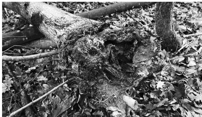
Typische Wurzelfäule infolge Hallimaschbefall